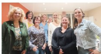
Membres du bureau