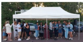
Fête des écoles 2024